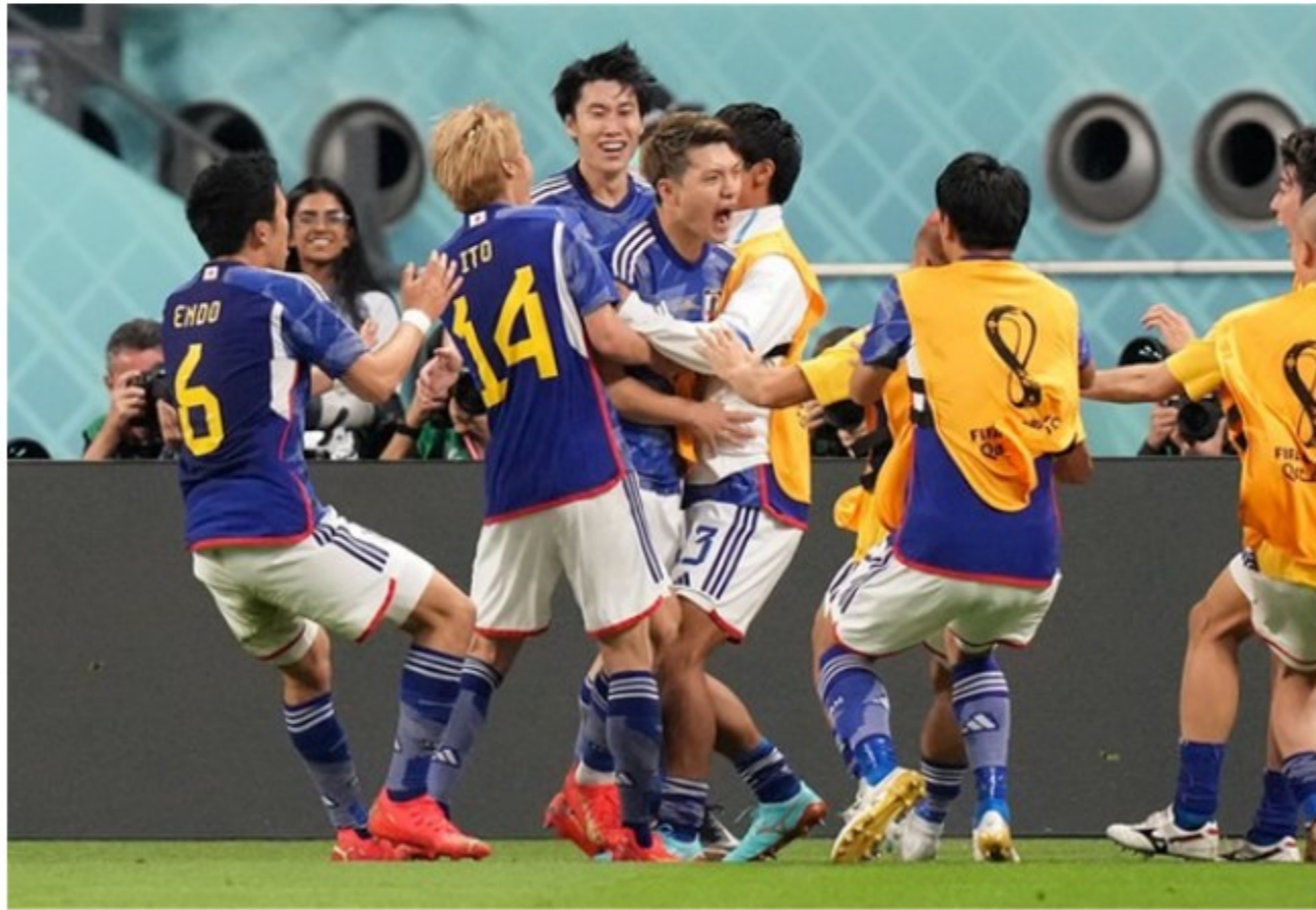
*일본 경기 장면