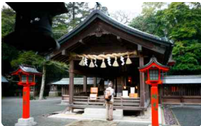
무나카타 지역 유적지