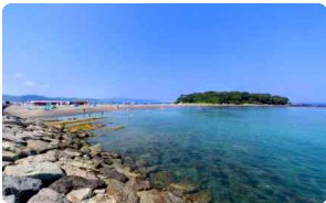
거룩한 섬 오키노시마