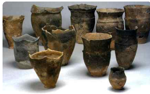
일본 고대 종교문화 이해